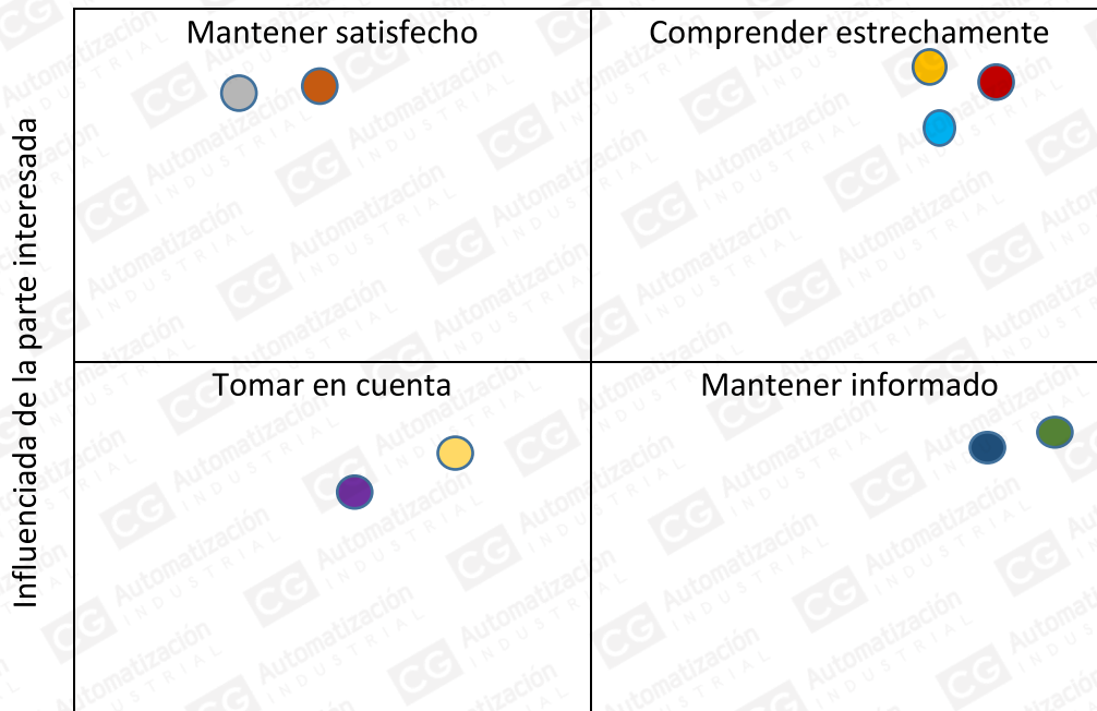
Diagrama de partes interesadas